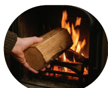
Kamin / Ofen